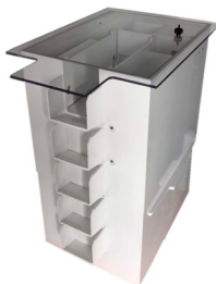
▶ RD VBT Réf. R0931