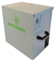
▶ RD BOX Réf. R0930