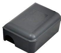
▶ BOBBY BOX Réf. R3225

Les données récoltées par le dispositif VIGIRAT permettent un management efficace des risques.